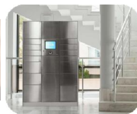
Model za dostavu paketa od nehrđajućeg čelika, s podnim postoljem