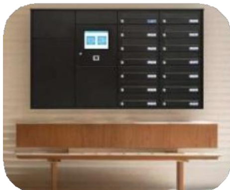
Model za dostavu paketa s poštanskim sandučićima