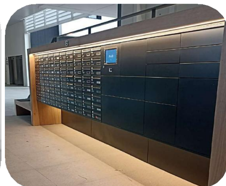
Model za pakete i poštu za ugradnju