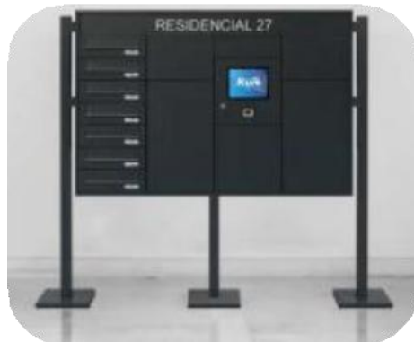
Model za pakete i poštu s podnim postoljem