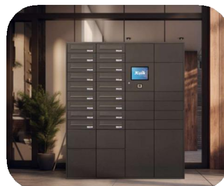
Model za pakete i poštu s centralnom nogom i bočnim nosačima