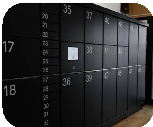
Prostor za odlaganje prtljage (Barcelona)